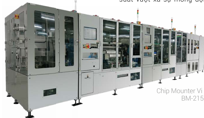
Chip Moulder Vi Mô BM-2150SI