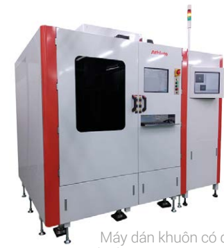
Máy dán khuôn có độ chính xác cao AB-1000

Với tầm nhìn rõ ràng, tinh thần đổi mới và cam kết vững chắc về chất lượng, Tập đoàn Athlete FA tiếp tục vạch ra con đường thành công trong bối cảnh sản xuất năng động của Nhật Bản. Khi công ty chuẩn bị đón nhận những thách thức và cơ hội của ngày mai, có một điều chắc chắn – sự cống hiến cho sự xuất sắc của công ty sẽ tiếp tục thúc đẩy sự phát triển và tác động của công ty trên phạm vi toàn cầu.