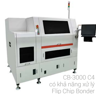
CB-3000 C4 có khả năng xử lý Flip Chip Bonder

Tập đoàn Athlete FA đã có mức tăng trưởng doanh thu vượt trội, với doanh số tăng theo tốc độ hàng năm là 50% kể từ năm 2020. Nhìn về tương lai, ông Yamazaki vạch ra các chiến lược để duy trì và đẩy nhanh việc mở rộng doanh